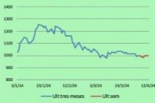
Dolar MEP (Bolsa)